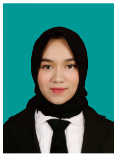
Foto terbaru berukuran 3x4 dan harus berlatar warna hijau toska dengan kode warna: 009B97 dapat di edit melalui berbagai aplikasi editing seperti canva, pics art dll